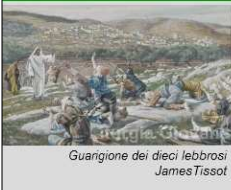
Guarigione dei dieci lebbrosi James Tissot